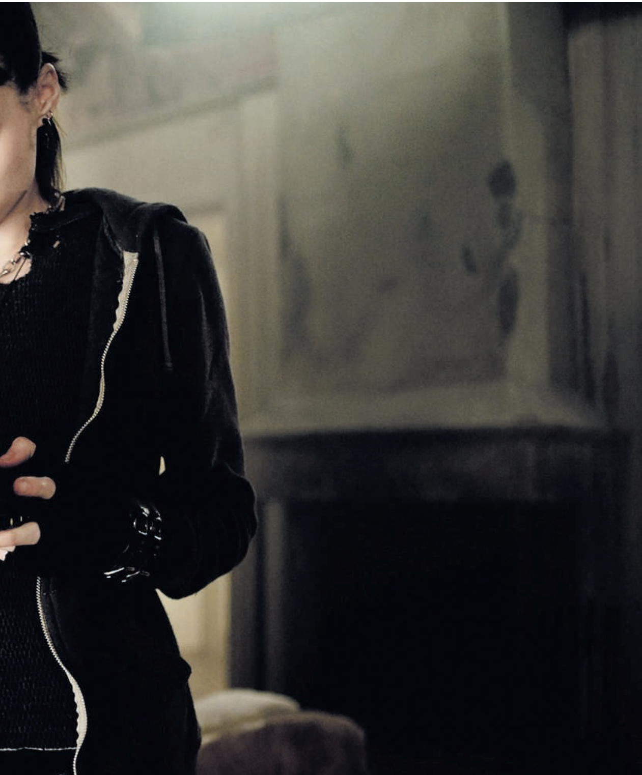
Rooney Mara schittert als hacker in de film 'The girl with the dragon tattoo'.

keren. Bij veel hacktivistten proef je ook een tegen de gevestigde orde gekeerde houding. Een deel associeert zich met de Occupy-beweging, al zien veel hackers die demonstraties niet als een manier om de wereld te veranderen. Daarvoor gebruiken ze liever hun technologische kennis.